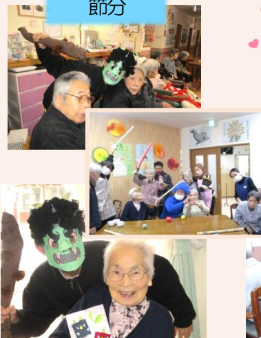
恒例の青い鬼が来ちゃったので皆さんでやっつけました。