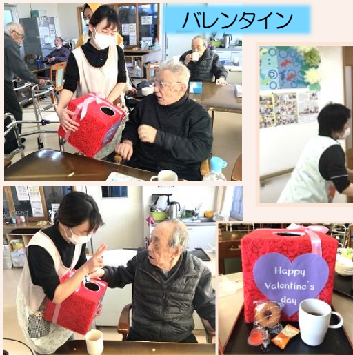
14日 バレンタイン お菓子のつかみ取りをおこないました。