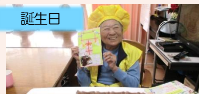
おめでとうございます！ お元気で過ごしてください☆