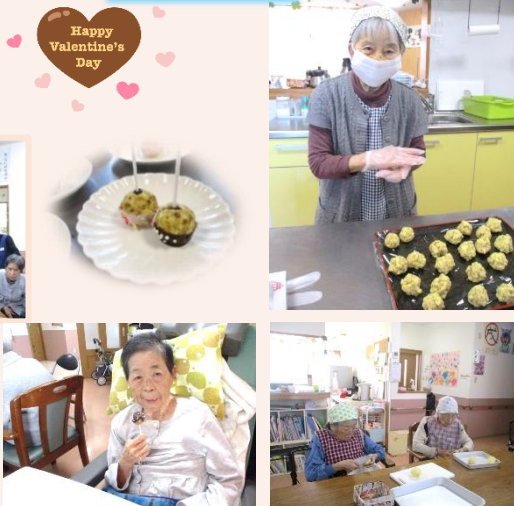
甘いチョコポップを手作りました♪