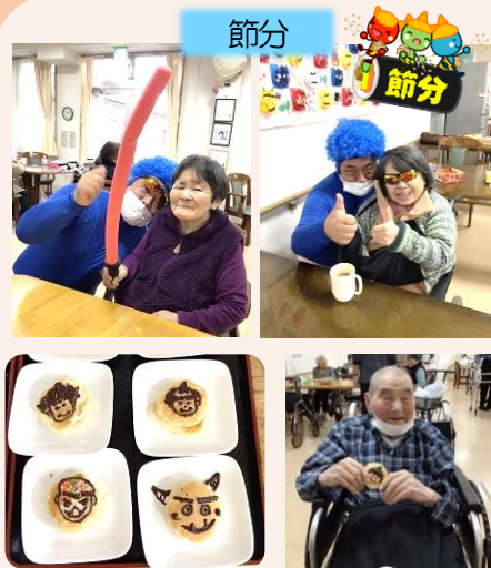
3日節分、ホットケーキにチョコで鬼の顔を描いたものをいただきました。