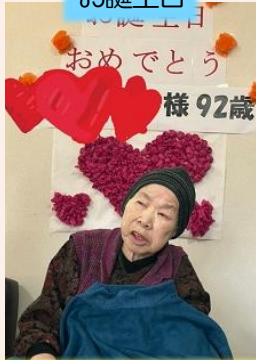
お誕生日おめでとうございます。