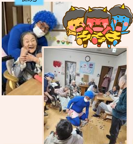
青鬼が来て皆で豆をぶつけました！