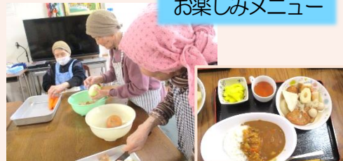
下ごしらえから皆さんで手作りました。 カレーライスとおでんをいただきました。