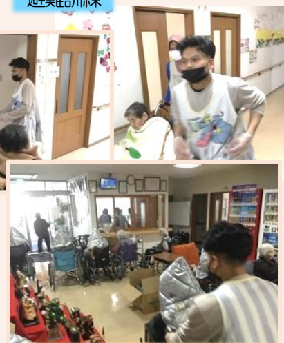
19日は夜間を想定した避難訓練をおこないました。