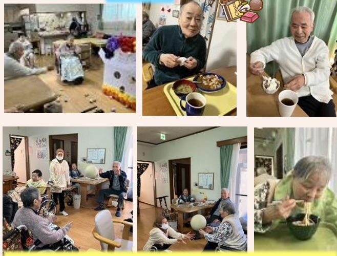
毎日レクリエーションやお茶を楽しみながら生活しています。