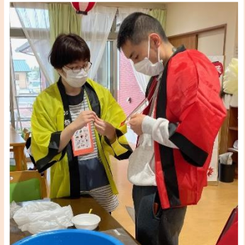
沢山すくえました！