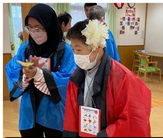
よく狙って・・・