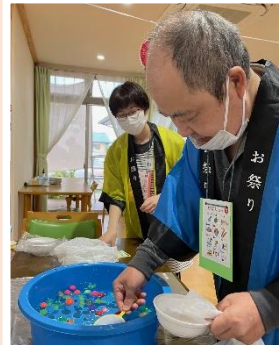
何匹すくえるでしょう？