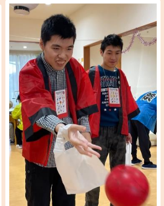
沢山倒せて 楽しかったです！