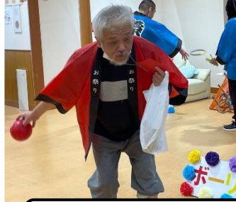
ストライク目指します！