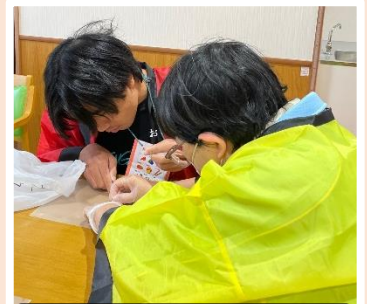
集中して取り組んでいます