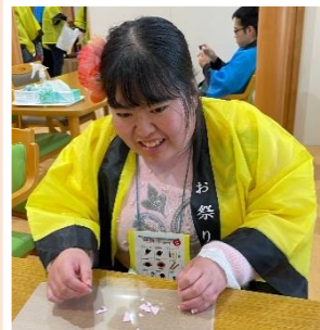
難しいですが頑張ります