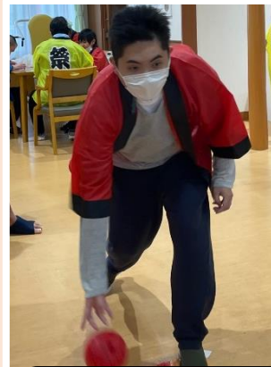
沢山倒せるように 頑張ります！