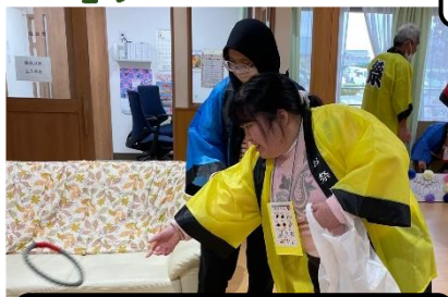
高得点の所を狙ってなげます！