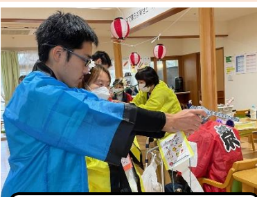
欲しい景品を狙います