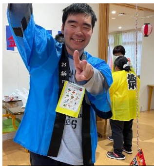
大きなお菓子が釣れて うれしいです！