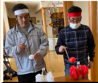
1.お玉でボールを運びます