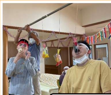
棒から下がっているパンを取ります