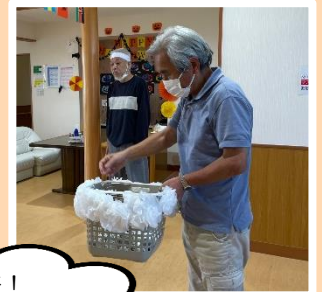
結果発表！ ドキドキします！