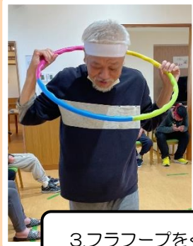
3.フラフープをくぐったらゴールです！