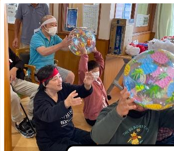
どちらがはやく送れるでしょう？