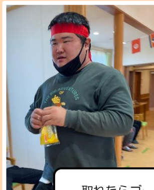
取れたらゴールを目指します！