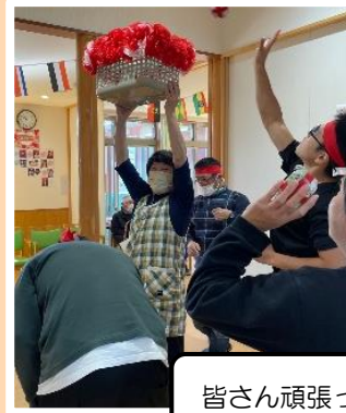
皆さん頑張ってカゴに玉を入れています！