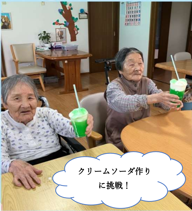
クリームソーダ作り に挑戦!