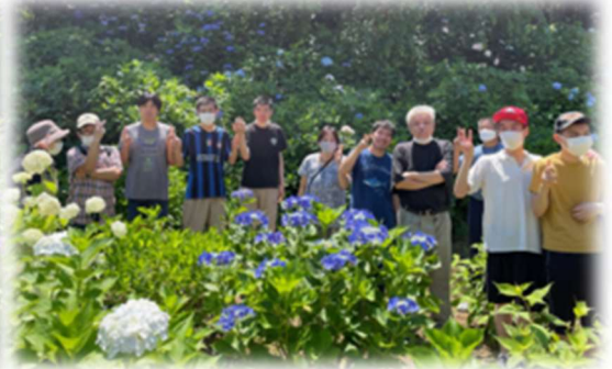
グループホーム あいホームつくば

梅雨に入り雨の日も増えましたが、 晴れ間を縫って各事業所あじさいを 見に行きました！