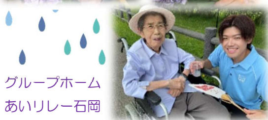
グループホーム あいリレー石岡