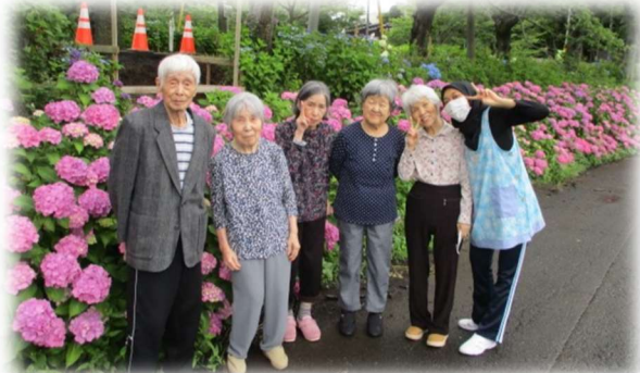
グループホーム あいリレーとよさと

梅雨に入り雨の日も増えましたが、 晴れ間を縫って各事業所あじさいを 見に行きました！