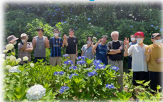
グループホーム あいホームつくば

梅雨に入り雨の日も増えましたが、 晴れ間を縫って各事業所あじさいを 見に行きました！