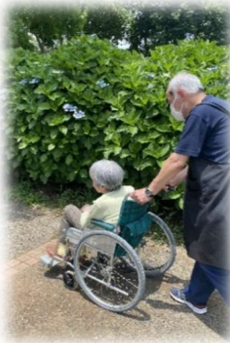
ショートステイ 「あいリレー石岡鹿の子」