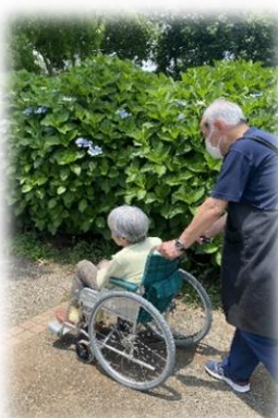
ショートステイ 「あいリレー石岡鹿の子」