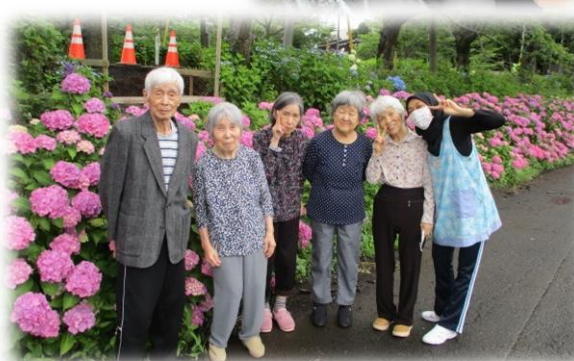
グループホーム あいリレーとよさと

梅雨に入り雨の日も増えましたが、 晴れ間を縫って各事業所あじさいを 見に行きました！