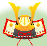
グループホーム あいリレーとよさと