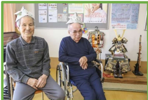
ショートステイ 「あいリレー石岡鹿の子」

社会福祉法人桐孝会 石岡市東光台 2-8-3 TEL 0299-26-7003 FAX 0299-28-0122