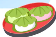
ショートステイ「あいリレーつくば」 かしわ餅を手作りし、おやつ時間に皆さんで召し上がっていました♪