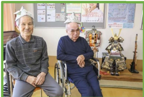
ショートステイ 「あいリレー石岡鹿の子」

社会福祉法人桐孝会 つくば市今鹿島 5703-7 TEL 029-847-5100 FAX 029-847-5102