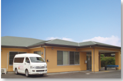
あいりレーつくば