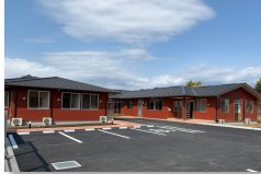
あいホームつくば