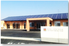
あいりレー・ケアホームつくば