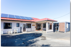
あいりレーとよさと