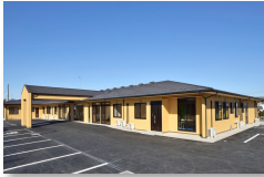
あいりレー石岡鹿の子