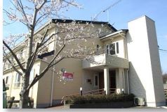
あいりレー・ケアホーム石岡