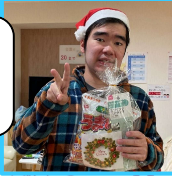
ビンゴ大会をしました。 ビンゴになった方から景品を選んでいただきました♪