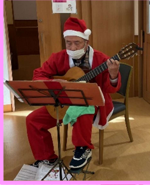
クリスマスソングを生のギター演奏に乗せて歌いました♪