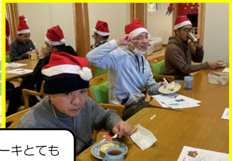
クリスマスケーキとても 美味しいです！

23日にクリスマス会を行いました。 皆さんでクリスマスケーキを召し上がったり、クリスマスソングを歌ったり、ゲームを行ったりしました。皆さんとても楽しめました。