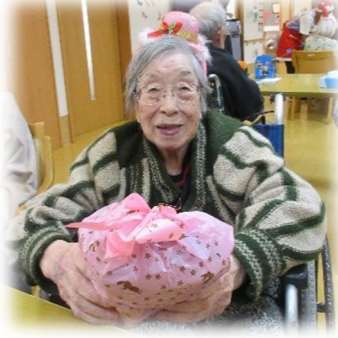
栄養士さんがかわいく作ってくれました♡