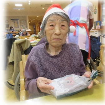
クリスマスメニュー