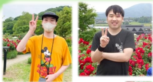
いばらきフラワーパークへドライブに行きました！色とりどりの満開のバラを見る事が出来ました♪