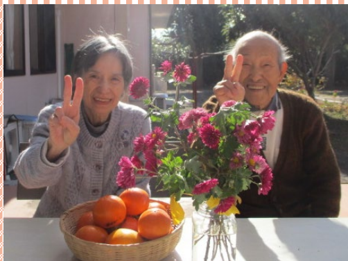
素敵な笑顔でハイチーズ！