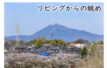
リビングからの眺め